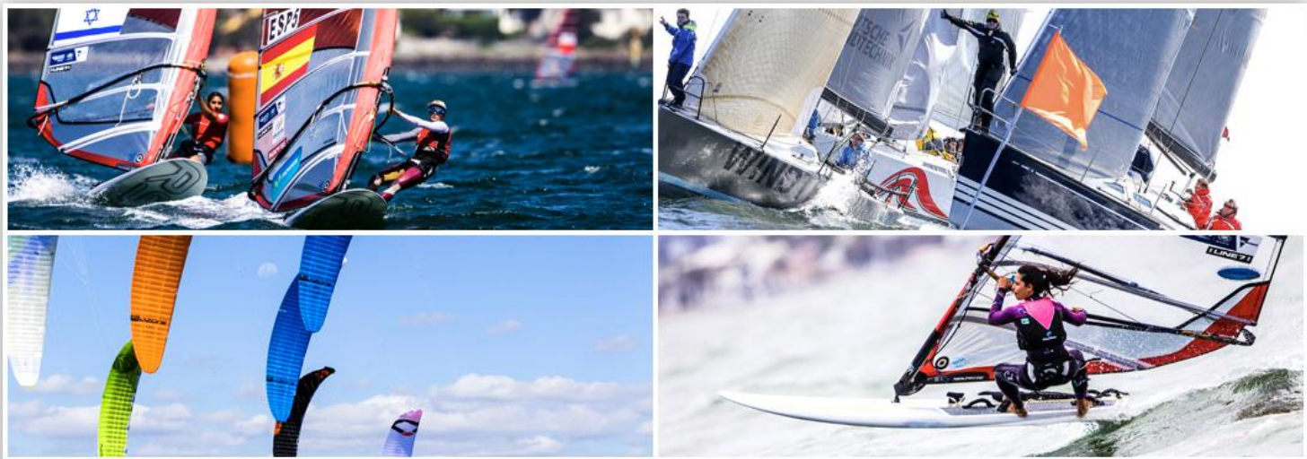
Tak til: Pedro Martinez / Christian Beeck