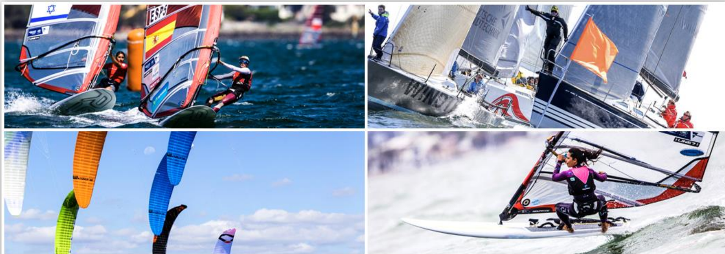
Tak til: Pedro Martinez / Christian Beeck